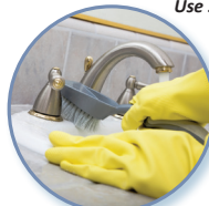
Limpieza más fácil