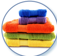
Ropa más limpia y brillante