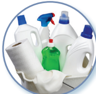
Use 50% menos jabón*